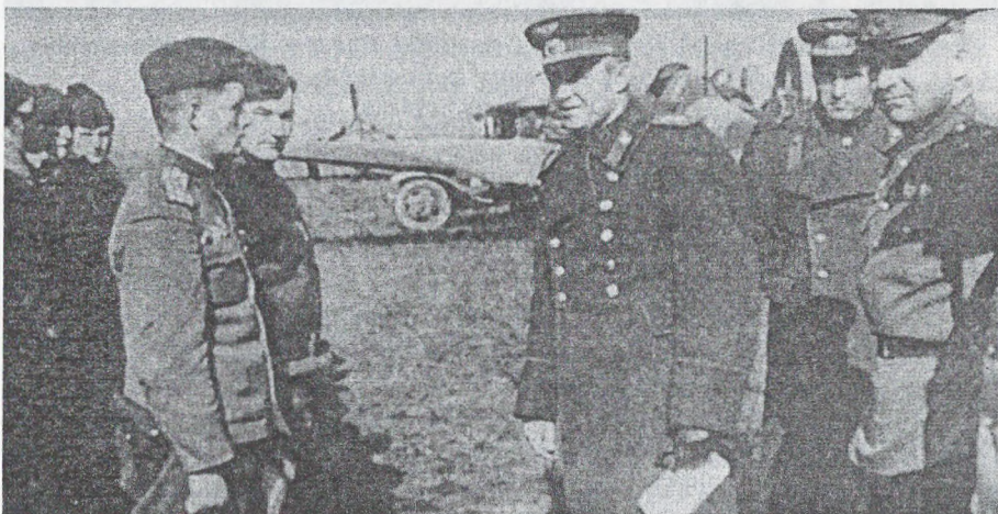
Командувач 16-ю Повітряною армією генерал-лейтенант С.Г. Руденко з льотним складом одного з авіаційних підрозділів. 1943 р.

Знаковим моментом виявилось те, що у липневі дні 1943 р., коли точилася битва на Курській дузі, Сергій Гнатович отримав особливу вказівку Верховного Головнокомандувача підняти у повітря всі літаки, аби послабити, а, можливо, навіть зупинити удар гітлерівців на головному напрямку. Командарм Руденко кинув на ворожі позиції 150 бомбардувальників у супроводі 200 винищувачів. Авіаційний удар армії виявився нищівним і наступ противника захлинувся.