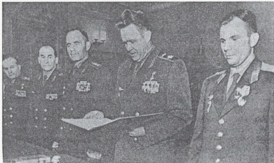
Маршал авіації Герой Радянського Союзу С.Г.Руденко оголошує вітальну адресу Військово-Повітряних сил першому космонавту Ю.О. Гагаріну. 1961 р.

Льотчики генерала Руденка брали участь у боях за звільнення Білорусії, у ході Варшавсько-Познанської, Східно-Померанської, Берлінської наступальних операцій. А в ході наступу на Вісло-Одерському напрямку з ініціативи Сергія Гнатовича вперше у практиці Великої Вітчизняної війни здійснено дислокацію наших авіаційних частин на аеродромах, захоплених радянськими танкістами у тилу ворога. Окрім того, авіатори пристосовували під аеродроми окремі ділянки колишніх ворожих автотрас.