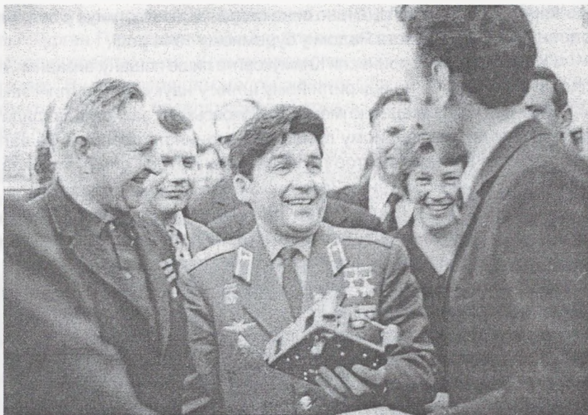
П.Климук на Чернігівському радіоприладному заводі (1976 р.)

Випускники колишнього Чернігівського авіаційного училища, між іншим, були також рекордсменами по кількості космічних польотів: у Анаталія Солов'йова – їх п'ять, у Петра Климук – три. Довгожителами космосу стали теж "чернігівці" – Леонід Кизим, Юрій Романенко, Володимир Титов, Леонід Попов.