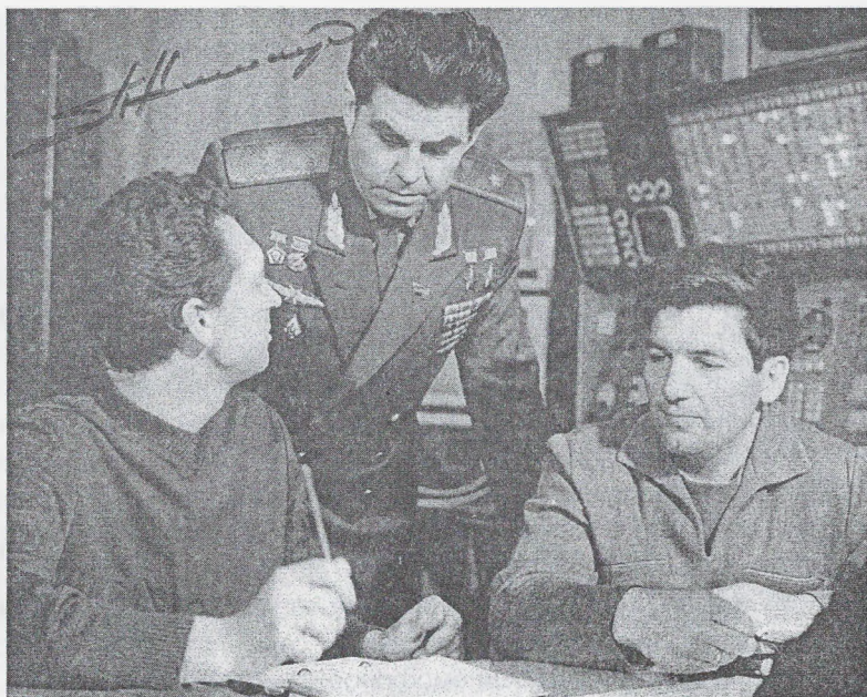
Начальник Центру підготовки космонавтів Г. Береговий, льотчик-космонавт П.Климук і бортінженер В.Севастьянов під час підготовки до польоту космічного корабля "Союз - 18". 1975 р.

Було безперечним одне: Петра Климук ніхто нікуди не запросив політати у космосі, бо разом з дипломом з відзнакою і лейтенантськими погонами він одержав розпорядження виїхати на Крайню Північ, де базувався авіаполк винищувальної авіації. Після зеленого і теплого Чернігова було важко звикати до суворого північного клімату. Польоти виявились напруженими, бо молодому офіцеру доводилося опановувати нові типи літаків. В його атестаційній характеристиці командир авіаполку зазначав: "Польоти любить, літає сміливо, упевнено. У повітрі ініціативний, кмітливий, витривалий..."