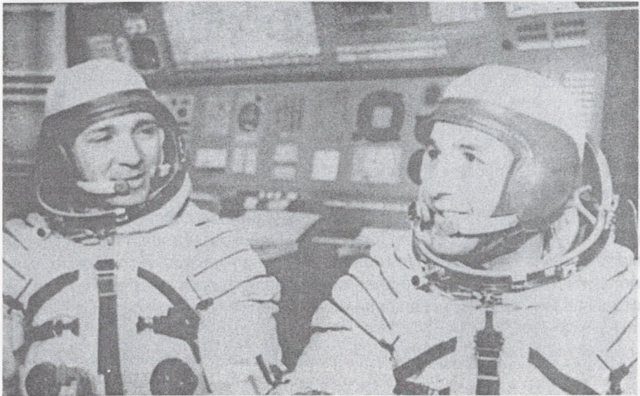
Командир космічного корабля "Союз-13" П.І.Климук (зліва) і бортінженер В.Лебедєв під час космічного польоту. 1973 р.

дукторів у приватних і державних помешканнях голосом неперевершеного диктора Всесоюзного радіо Юрія Левітана сповістили про перший в історії всесвіту політ людини у Космос. Це був радянський громадянин, двадцятисемирічний військовий льотчик Юрій Олексійович Гагарін. Володарі телевізорів увімкнули свої приймачі і побачили на екрані пречудове усмінене обличчя Юрочки, Юрасика, Юри. Так любовно охрестили першопроходця Космосу. Народжених того дня хлопчиків мами назвали іменем космонавта. Лише через п'ять років, коли його не стало, вся країна і чернігівці дізнались, що за польотом Юрія Гагаріна стояв Генеральний конструктор космічних кораблів і наш земляк Сергій Павлович Корольов.